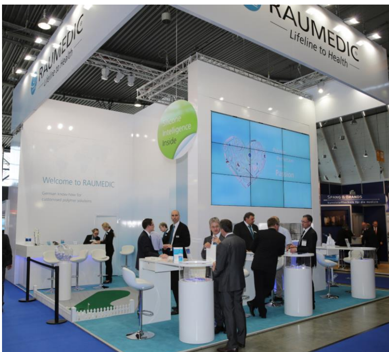
Silicone Intelligence Inside war das RAUMEDIC-Motto auf der diesjährigen Medtec Europe