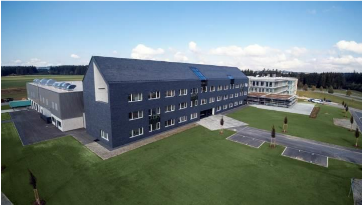
Sicht auf das neue Gebäude

RAUMEDIC baut parallel seine internationale Präsenz aus. So wird bis Ende 2015 auch in Mills River, im US-Bundesstaat North Carolina, ein neues Produktions- und Technologiezentrum entstehen.